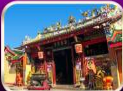
ศาลเจ้าแม่ลิ้มกอเหนี่ยว

ที่เที่ยวเพิ่มขึ้น และ ช่วยฟื้นฟูเศรษฐกิจภาคใหญ่