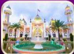
ชมบึงฮิดกลางปีตธานี