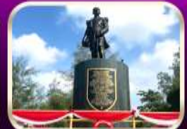
อนุสาวรีย์กรมหลวงชุมพรฯ