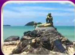
เที่ยวหาดสมิหลา สงขลา