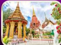
หอพระหลวงปู่ทวด วัดช้างให้