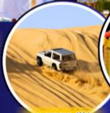
รถเช่าราย 4X4