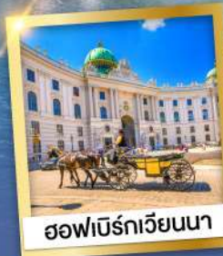
ฮอฟเบิร์กเวียนนา