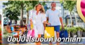
ป๊อปปิงโรมอนด์ ไอคาเล็ก