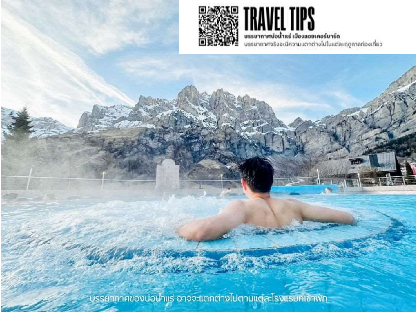
บรรยากาศของบ่อน้ำแร่ อาจจะไม่แตกต่างกันไปตามแต่ละโรงแรมที่เข้าพัก

บรรยากาศบ่อน้ำแร่ เมืองลอยเคอร์บาด บรรยากาศจริงจะมีความแตกต่างไปในแต่ละฤดูกาลท่องเที่ยว