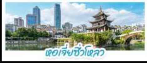
เฉิงเฉิงชิวโหลว

ผ่านชมสะพานหุบเขาฮวาจิง สะพานแขวนที่สูงที่สุดในโลก ชมปราสาทลับคิสนีย์ XINGYI JILONGBAO CASTLE แห่งมณฑลกุยโจว น้ำตกหวงกู่ (รวมบันไดเลื่อน) • ชมหอเจี๋ยชิวโหลว (JIAXIU TOWER) สัญลักษณ์และแลนด์มาร์กสำคัญของเมืองกุยหยาง มณฑลกุยโจว