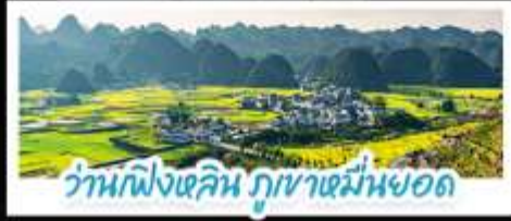
ว่านผิงเจิน ภูเขาหมื่นยอด