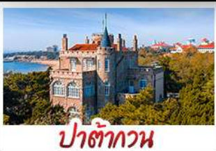
ป่าตักกวน

พระราชวังฤดูร้อน - วิวเมืองซิงเต่า รถไฟความเร็วสูง - ภูเขาเหลาซาน กำแพงเมืองจีนด้านจวียงกวน - ป่าตักกวน พักโรงแรมระดับ 4 ดาว - ไม่ลงร้านซื้อ มือพิเศษ เปิดปักกิ่ง , หม้อไฟซีฟู้ด