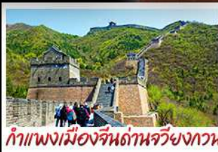
กำแพงเมืองจีนด้านจวียงกวน