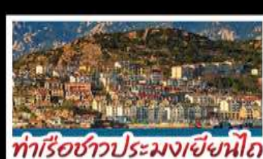
ท่าเรือชาวประมงเยียนไถ