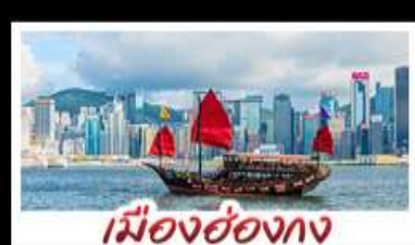
เมืองฮ่องกง

เมืองเก่าชิงเต่า - วิวเมืองอ่องกง โรงเบียร์ชิงเต่า - ท่าเรือชาวประมงเยียนไถ