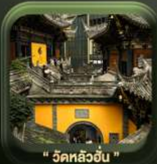
" วัดหลิวอัน "