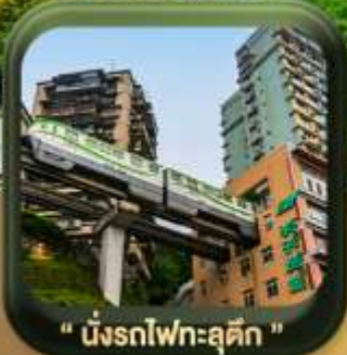
" นั้งรถไฟทะลุตึก "

บินตรงลงดงชั่ง • อุ้หลง หลุมฟ้าสะพานสวรรค์ • ระเบียบแก้ว • อุทยานเขานางฟ้า หงหยาดัง • นั้งรถไฟทะลุตึก • ศาลาประชาคม (ด้านนอก) • หลงหมินฮ่าว มรดกโลกผาหินแกะสลักต้าจู้ • วัดหลิวอัน • ตึกตะเกียบ • ถนนคนเดินเจียฟางเป้ย