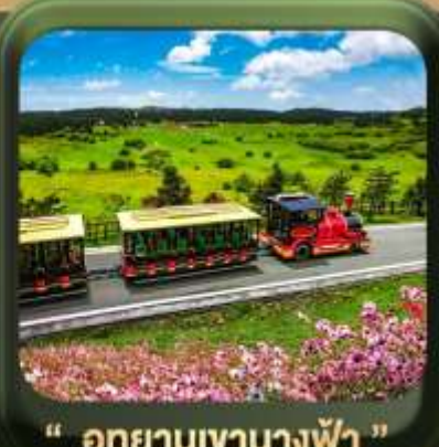
" อุทยานเขานางฟ้า "