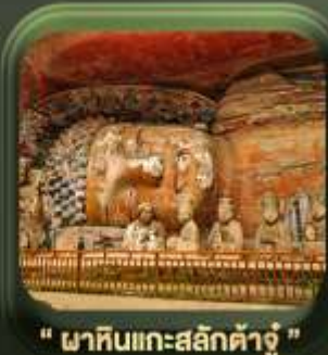
" ผาหินแกะสลักต้าจู้ "

T2G-CKG26CZ Special of Chongqing...ลงชั่ง ต้าจู้ อุ้หลง อุทยานหลุมฟ้า เขานางฟ้า 5D 3N (CZ)