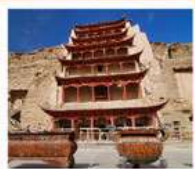
ถ้ำม่อเถา