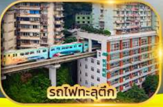
รถไฟฟ้าสุดค