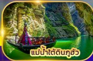
แม่น้ำใต้ดินกุ๋ว