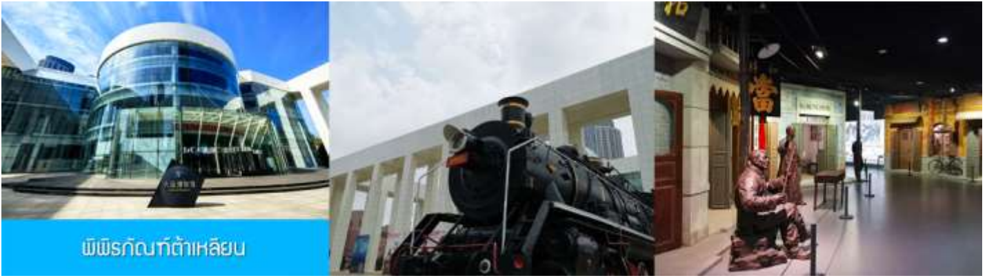
พิพิธภัณฑ์ต้าเหลียน