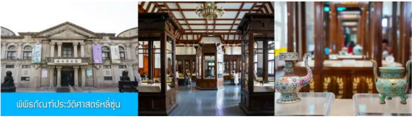
พิพิธภัณฑ์ประวัติศาสตร์หลู่ซุ่น

จากนั้นนำท่านเที่ยวชมและเก็บภาพ ณ พิพิธภัณฑ์ประวัติศาสตร์หลู่ซุ่น 旅顺博物馆 เป็นอาคารพิพิธภัณฑ์เก่าแก่อายุกว่าร้อยปีแห่งแรกที่สร้างขึ้นทางภาคตะวันออกเฉียงเหนือของจีน อาคารพิพิธภัณฑ์มีความโดดเด่นด้วยสถาปัตยกรรมแบบกรีกโรมันยุคเรเนซองส์ ผสมผสานสถาปัตยกรรมแบบตะวันออก ภายในมีการจัดแสดงโบราณวัตถุกว่า 60,000 ชิ้น ท่านสามารถเก็บภาพที่ระลึกด้านหน้าอาคารพิพิธภัณฑ์ และสามารถเข้าชม โบราณวัตถุภายในพิพิธภัณฑ์ได้ตามอัธยาศัย (พิพิธภัณฑ์ปิดทุกวันจันทร์)..