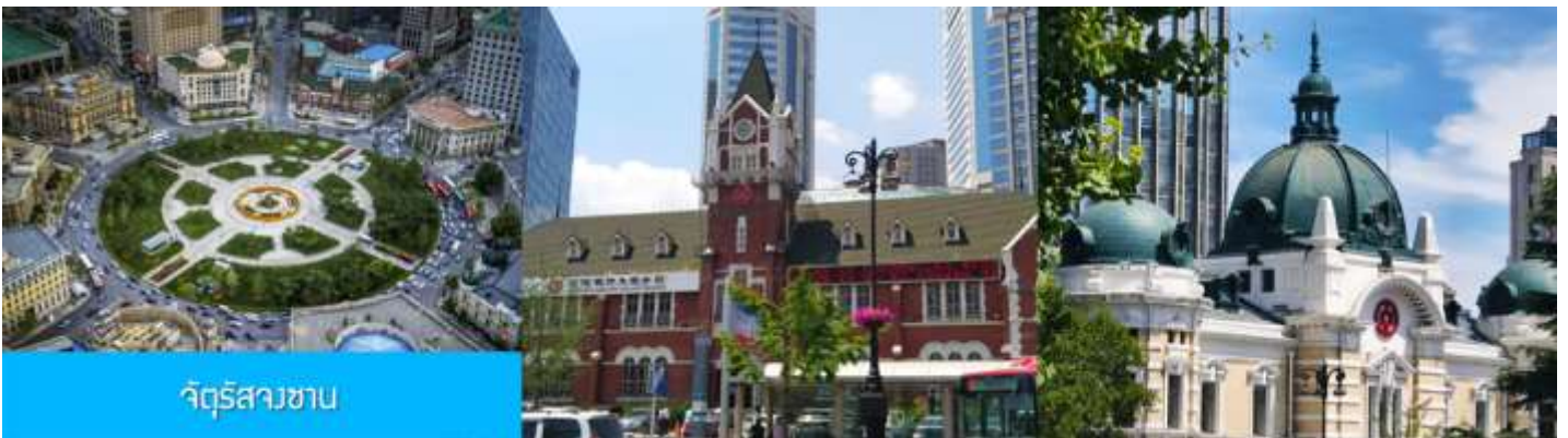
จัตุรัสสวน