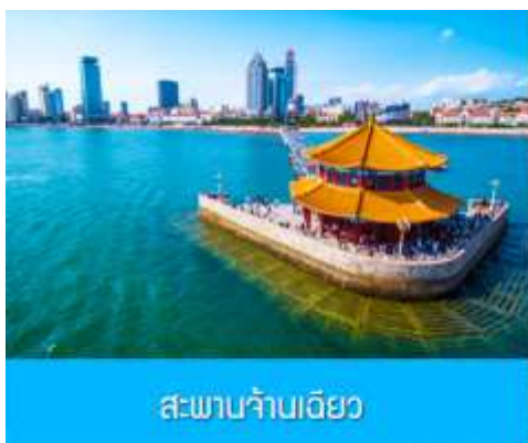
สะพานจ้านเฉียว

เช้า รับประทานอาหารเช้า ณ ห้องอาหารของโรงแรม (1)