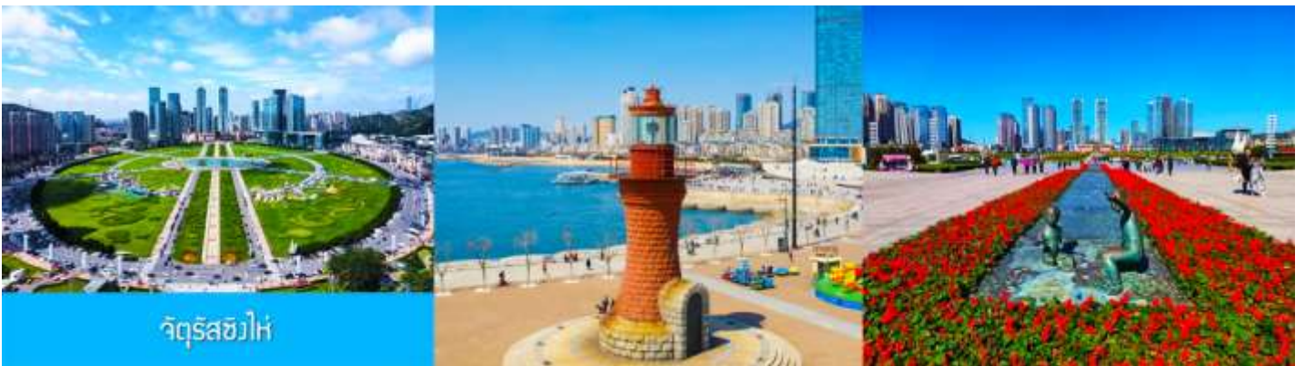
จัตุรัส星海

จากนั้นนำท่านเที่ยวชมและเก็บภาพ ณ พิพิธภัณฑ์ประวัติศาสตร์หลู่ซุ่น 旅顺博物馆 เป็นอาคารพิพิธภัณฑ์เก่าแก่อายุกว่าร้อยปีแห่งแรกที่สร้างขึ้นทางภาคตะวันออกเฉียงเหนือของจีน อาคารพิพิธภัณฑ์มีความโดดเด่นด้วยสถาปัตยกรรมแบบกรีกโรมันยุคเรเนซองส์ ผสมผสานสถาปัตยกรรมแบบตะวันออก ภายในมีการจัดแสดงโบราณวัตถุกว่า 60,000 ชิ้น ท่านสามารถเก็บภาพที่ระลึกด้านหน้าอาคารพิพิธภัณฑ์ และสามารถเข้าชม โบราณวัตถุภายในพิพิธภัณฑ์ได้ตามอัธยาศัย (พิพิธภัณฑ์ปิดทุกวันจันทร์)..