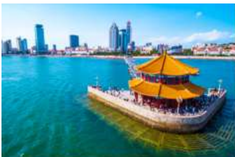
สะพานเจียวเจียว

เช้า รับประทานอาหารเช้า ณ ห้องอาหารของโรงแรม (1)