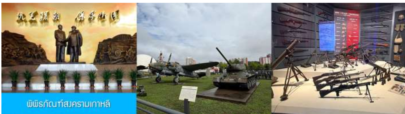
พิพิธภัณฑ์สงครามเกาหลี