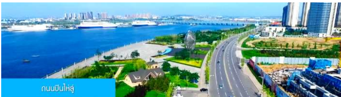
ถนนปินไห่หลู่