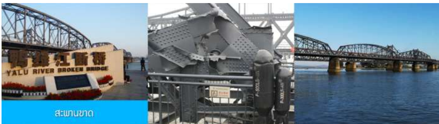
สะพานขาด