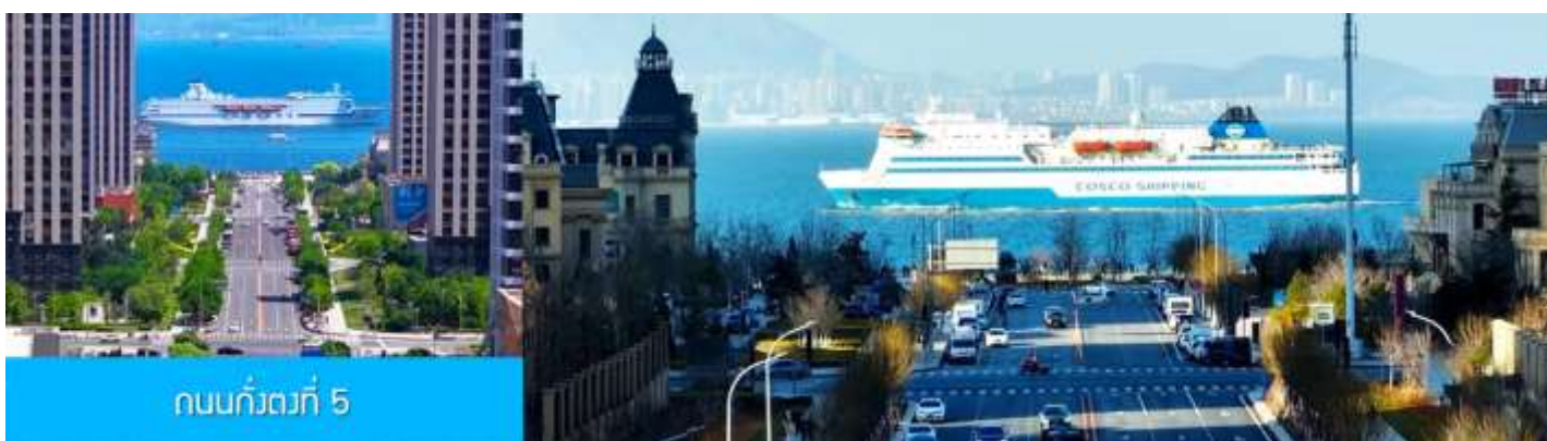
ถนนกั๋วตงที่ 5

หลังอาหารนำท่านเที่ยวชม ถนนกั๋วตง 5 港东五街 จุดเช็คอินใหม่ที่ได้รับความนิยมอย่างสูงจากนักท่องเที่ยว