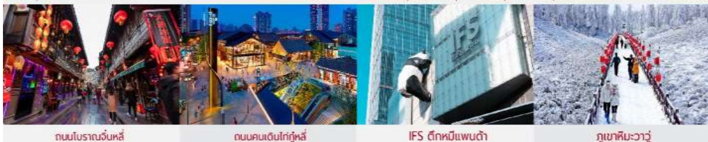
ถนนโบราณจิ้นหลี่