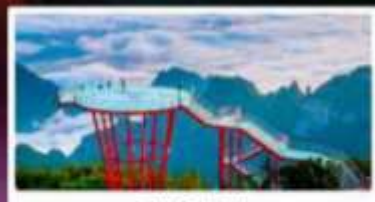
กุเวา 7 ดาว