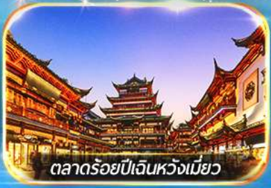
ตลาดร้อยปีเงินหวงเมี่ยว

ถ่ายรูปชมสวนนอร์ทบันด์ , เชคอินหาดไว่ทาน, วัดพระหยกขาว อิสระช้อปปิ้งถนนนานกิง POPMART FLAGSHIP STORE