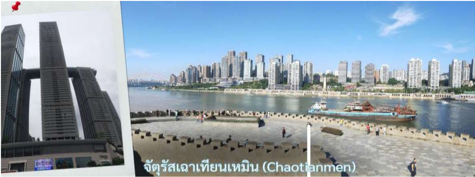
จัตุรัสฉาเทียนเหมิน (Chaotianmen)

การคัดกรองวงจรถาเทียนเหมิน ซึ่งถือเป็นตลาดขนาดใหญ่ที่สุดของฉงชิ่ง ทำให้พื้นที่โดยรอบเต็มไปด้วยผู้คนและมีชีวิตชีวาอยู่เสมอ ตั้งแต่อดีตจนถึงปัจจุบัน จัตุรัสแห่งนี้ได้รับการออกแบบให้มีลักษณะคล้ายเรือยักษ์ที่กำลังแล่นออกสู่สายน้ำอย่างสง่างาม จึงได้รับสมญานามว่า “ไททานิคแห่งฉงชิ่ง” เมื่อยืนอยู่บนจัตุรัส ท่านจะสามารถมองเห็นภาพอันน่าประทับใจของจุดบรรจบระหว่างแม่น้ำสองสาย โดยน้ำสีเหลืองของแม่น้ำแยงซีและน้ำสีเขียวมรกตของแม่น้ำเจียหลิงไหลมาบรรจบกันอย่างชัดเจน สร้างทัศนียภาพที่สวยงามและเป็นเอกลักษณ์ของฉงชิ่งอย่างแท้จริง