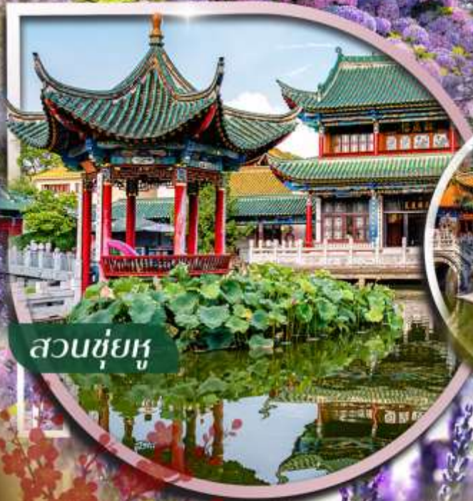
สวนชู่ยู่