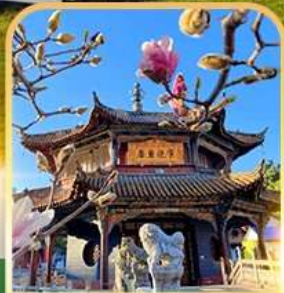
วัดหยวนทอง