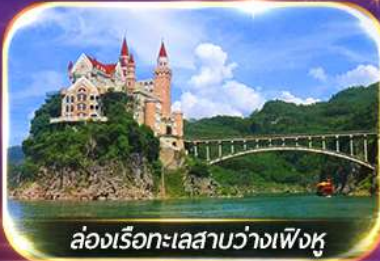
ล่องเรือทะเลสาบว่างเฟิงหู