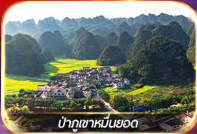
ป่าภูเขาหมื่นยอด