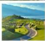
กุซางอวี่นเซียงซาน