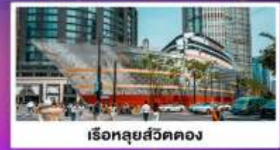
เรือหลุยส์วิตตอง