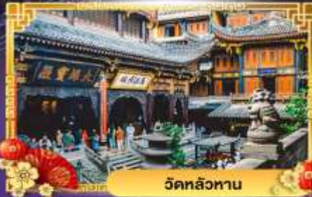
วัดหลัวหนาน