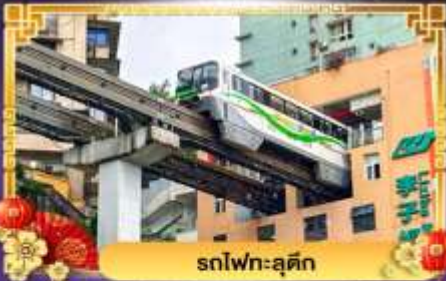
รถไฟฟ้า-ลูตึก