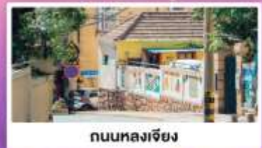
ถนนหลงเจียง