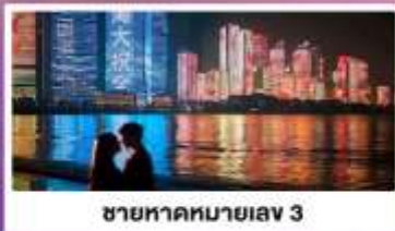
ชายหาดหมายเลข 3