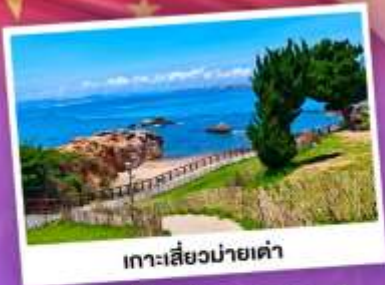
เกาะเสี่ยวม้าเต๋า

เที่ยวชิงเต๋า เมืองทะเลสุดชิล ครบทั้งกิน เที่ยว ถ่ายรูป