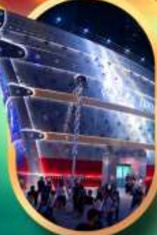
เรือคอะหลุยส์