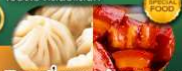
พิเศษ เสี่ยวหลงเป่า หมูแดงพอ เดินทาง ม.ค. - มิ.ย. 69