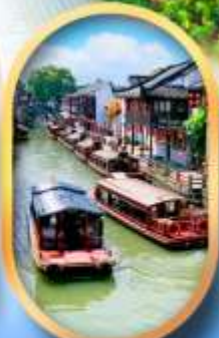
ถนนชานกั๊งเจีย