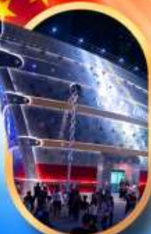
เรือคองคอง