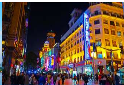
ถนนคนเดินหนานจิงอู่