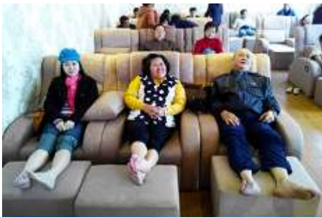
ศูนย์วิจัยแพทยแผนจีน