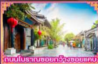
ถนนโบราณซอยกว้างซอยแคบ