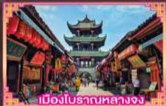
เมืองโบราณกลางจ