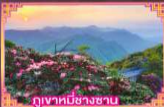
ภูเขาที่มีชาวชน