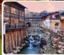
เมืองโบราณเหย้าหู