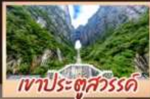
เขาประตู่สวรรค์