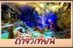
ถ้ำจิ่วเทียน