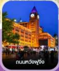
ถนนทงฟู่จิ่ง