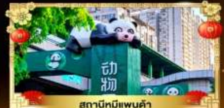
สถานีหมีแพนด้า