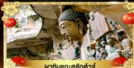
นาหินแกะสลักต้าจู้