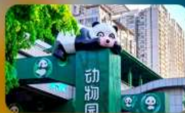
สถานีหมี่แพนด้า