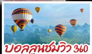
บอลลูนชมวิว 360