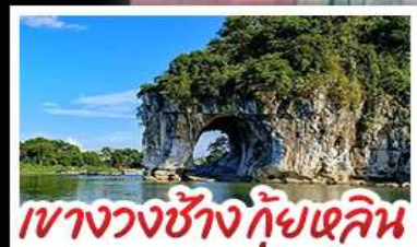
เขาวงซ้างภูเขาซัว