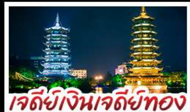
เจดีย์เงินเจดีย์ทอง

ล่องแพไม้ไผ่ แม่น้ำหลี่เจียง - ภูเขาหู่ยี่ ภูเขาไปกลับ บ้านบันไดหลงเซิน - เจดีย์เงินเจดีย์ทองวิวดำ เขาวงซ้าง - บอลลูนชมวิว 360 ambuพิศข บูฟฟิตบึงย่างบาร์บิคิว ปลายอบเบียร์ เผือกคริสตล สุกี้หืด