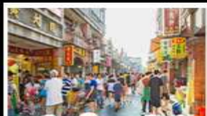
เมืองโบราณต้าชี่

ล่องแพไม้ไผ่ชมแม่น้ำหลี่เจียง - กางวงช้าง กำฟู้อ้อ - เมืองโบราณต้าชี่ เจดีย์เงินเจดีย์ทองวิฑู ช้อปปิ้งถนนคนเดิน - ถนนคังซีเซียง - ถนนซีเจีย เมบูพิศษ บูฟัพศซาบูชัพุด ปลาอบเบียร์ สุกี้หืด