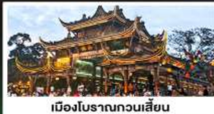
เมืองโบราณทวนเสียน