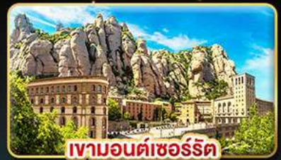
เขามอนต์ซอร์ริต