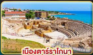
เมืองคาร์ราโกนา