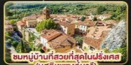
ชมหมู่บ้านที่สวยงามที่สุดในฝรั่งเศส (มูสติเยแซงก์มาร์)