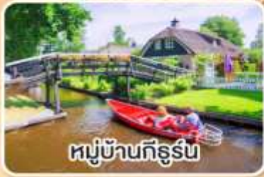
หมู่บ้านทีร์ูร์น