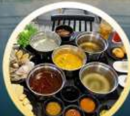
ชาบูฮ่องกง

02-04 มี.ย. 18-20 มี.ย. 07-09 มี.ย. 20-22 มี.ย. 13-15 มี.ย. 25-27 มี.ย. 14-16 มี.ย. 28-30 มี.ย.