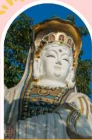
ริพลัสเบย์