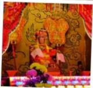
เจ้าแม่กัปกิม จอสเฮาส์เบย์