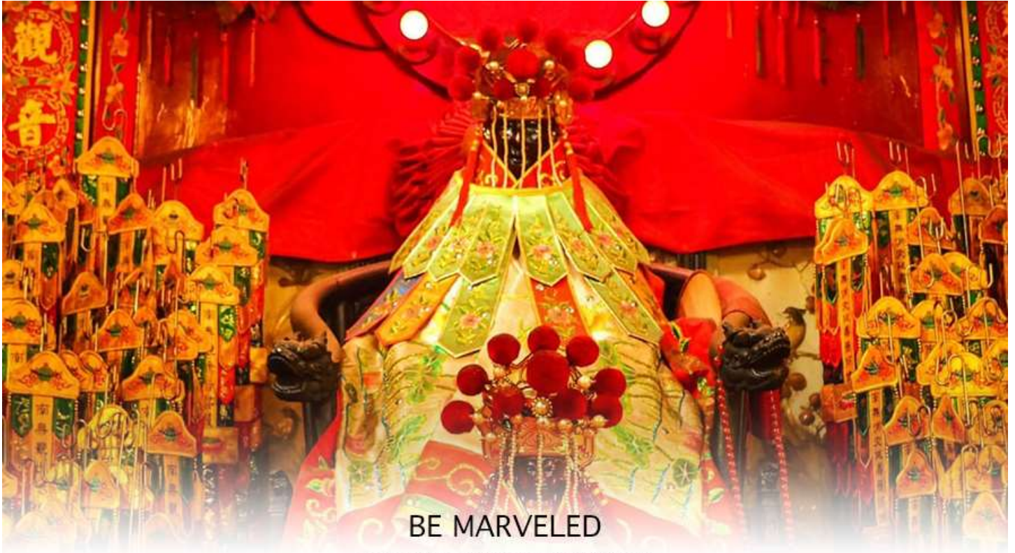
BE MARVELED วัดเจ้าแม่กวนอิมฮวงอ่า (ยิมวิน)

เชื่อของคนจีนใน ฮ่องกง-มาเก๊า จะมี ”วันเปิดทรัพย์“ หรือ ”พิธียืมเงิน เจ้าแม่กวนอิมฮ่องกง“ เป็นวันที่จะมาขอพรและยืมเงินเจ้าแม่กวนอิมซึ่งนับจากหลังวันตรุษจีน ไป 26 วัน จะเป็นวันเปิดทรัพย์ที่จัดขึ้นในทุกๆปี พิธีนี้จะมีเพียงครั้งปีละครั้งเท่านั้น เป็นวันสำคัญอีกวันที่คนหลังไหลมาไหว้ขอพรอย่างไม่ขาดสาย