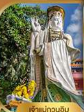
เจ้าแม่กวนอิม รับลิสเบย์