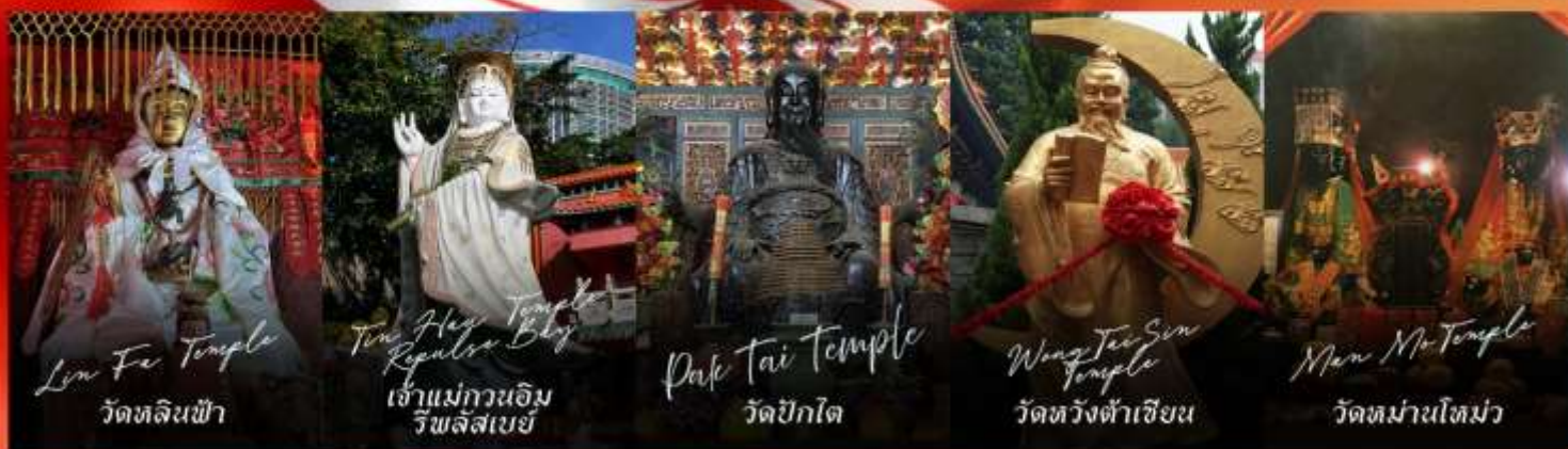
Lun Fe Temple วัดหลินฟ้า

รายการทัวร์ข้างต้นอาจมีการปรับเปลี่ยนเพื่อความเหมาะสม