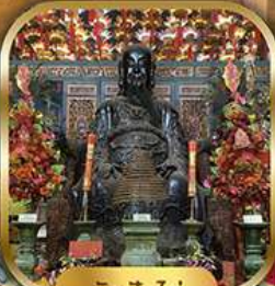
วัดปุกใต้