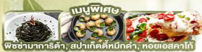
พิซซ่ามาการิตต้า, สุปาเก็ตตี้หมึกดำ, หอยเอสคาโก้