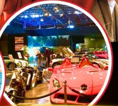
Royal Automobile Museum