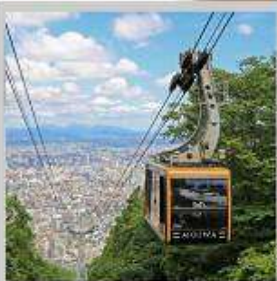
"MT. MOIWA ROPEWAY"