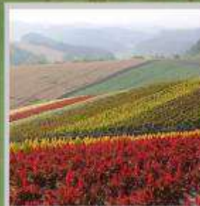
"SHIKISAI NO OKA"