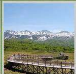
"SHIRETOKO 5 LAKES"