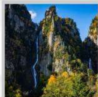
"GINGA & RYUSEI FALLS"

ต้นตอ "ทุ่งดอกพืชมอส ณ สวนดอกชิบะซากุระ-อิงะชิโมะโคะโคะ" ด้วยพรมสีชมพูที่มีพื้นที่ขนาดใหญ่ถึง 100,000 ตารางเมตร ชม "ทะเลสาบคาบสมุทรชิเรโตโกะ" เกิดมาจากการระเบิดของภูเขาไฟโอเอและน้ำพุใต้ดิน จนเกิดเป็นทะเลสาบทั้ง 5 ของชิเรโตโกะ "ฟาร์มสุนัขจิ้งจอกฮอกไกโด" ฟาร์มสุนัขจิ้งจอกแห่งเดียวของเกาะฮอกไกโด สายพันธุ์ท้องถิ่นคือ สายพันธุ์ Ezo red fox เพลิดเพลินกับ "เนินสีฤดู" เนินเขากว้างใหญ่ที่มีดอกไม้ไม้บานาพันธุ์นับ 30 ชนิดปลูกเรียงรายสลับสีกันเป็นแนวยาว นำท่าน "นั่งกระเช้าภูเขาคุโรดะเคะ" เชื่อมจากเชิงเขาของเมืองโซอุนเคียวถึงยอดเขาคุโรดะเคะที่มีความสูงถึง 670 เมตร ไฮไลท์ "ส่องเรือราอูสี ชมความงามของวาฬเพชรฆาต" บริเวณคาบสมุทรชิเรโตโกะ มรดกโลกทางธรรมชาติของฮอกไกโด