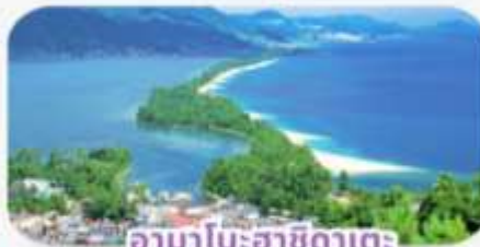
อามาโมะฮาซิดาเตะ