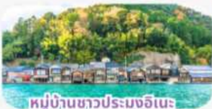
หมู่บ้านชาวประมงอิเนะ