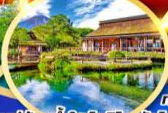
หมู่บ้านน้ำใสโอชิโนะอัทสึโกะ