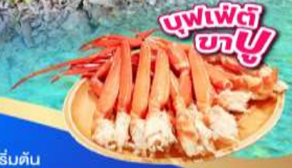
บุฟเฟ่ต์ ชาบู