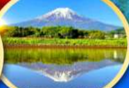
ทะเลสาบคาวากูจิโกะ