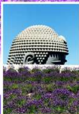
เจดีย์พระพุทธรเจ้า